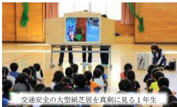
交通安全の大型紙芝居を真剣に見る1年生

9月28日（金）、帯広市交通指導員と交連協啓西支部の方々を講師にお招きして、1年生を対象に「交通安全教室」と「昔の遊び体験」を行いました。「交通安全教室」では、紙芝居を使って道路を渡る時の注意事項や、飛び出しの危険性を教えていただき、その後の「昔の遊び体験」では、だるま落としや、けん玉・輪投げなどが体験できるコーナーが設けられ、子どもたちはそれぞれの遊びを夢中で楽しんでいました。