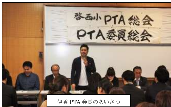
伊香PTA会長のあいさつ

4月25日(水)、平成30年度のPTA総会が開催されました。あいにくの雨模様にもかかわらず、多くの保護者の方々にご来校いただき、教職員を含め100名を超える出席となりました。総会では各部の事業計画案や役員改選が行われ、新年度のPTA活動がいよいよスタートとなりました。伊香PTA会長を先頭に、新役員で啓西小学校PTAの舵取りをしてまいります。全会員で協力してPTA活動を盛り上げていただければと思っています。