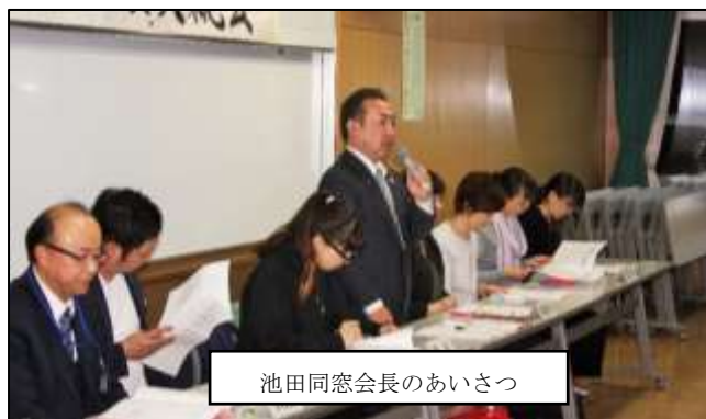
池田同窓会長のあいさつ

5月17日(木) には「PTA 第1回常任委員会」19:00~の開催を予定しています。PTA常任委員会は、部長・副部長さんにご案内を差し上げています。お忙しい中ですが、ご参加をお願いします。