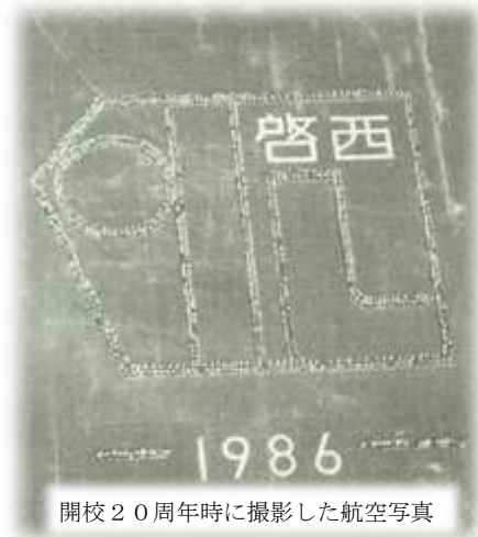
開校20周年時に撮影した航空写真

記念事業の第2弾として、6月28日(水)に航空写真の撮影を行います。グラウンドに子ども達が啓西小学校の校章を人文字で形取り、軽飛行機からその様子を撮影します。バルーンセレモニー同様、人文字を作ること、飛行機が飛んできて写真を撮って